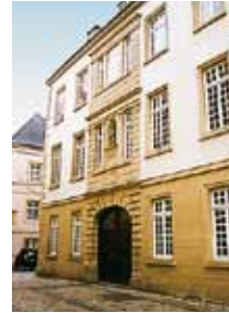
Maison 2, rue de la Congrégation: au-dessus du porche d'entrée; Chronogramme: année 1676; auteur inconnu