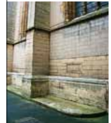
Kathedrale Unserer Lieben Frau von Luxemburg: im Binnenhof, an der west- lichen Außenwand der Kathedrale