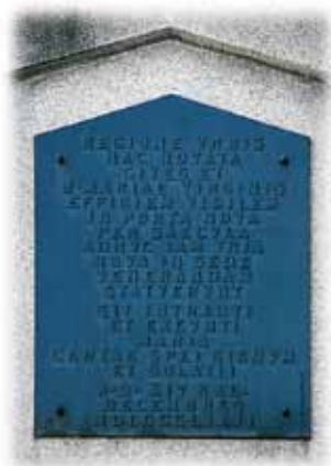
Maison 19, avenue de la Porte-Neuve au-dessus d'un arceau surplombant le trottoir côté nord: Auteur: Simone Beck